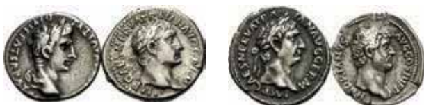
395- EMPIRE ROMAIN. Lot de 4 deniers. AUGUSTE (31 av.-14 ap.). Denier, Lyon (2av.-4ap.). (Giard, n° 1656 - Cohen, 43 - RIC, n° 207-351). TRAJAN (98-117). Deniers, Rome, 100 et en 101/102. Victoire assise et Victoire debout, à gauche. (BnF, n° 81, 126 - Cohen, n° 214, 242 - RIC, n° 40, 60). - HADRIEN (117-138). Denier, Rome, 134/138. L'Afrique allongée à gauche. (Cohen, n° 140 - RIC, n° 299). Argent. Très Beau. Lot de 4 monnaies. 300/400