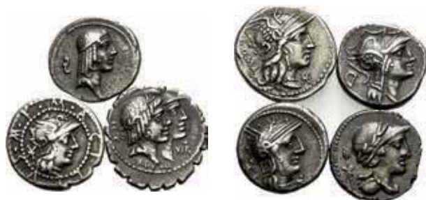
393- Lot de 7 deniers. Familles Acilia, Calpurnia, Fufia, Fulvia, Junia, Opimia, Volteia. Dans l'ensemble, Très Beau. Lot de 7 monnaies. 200/400