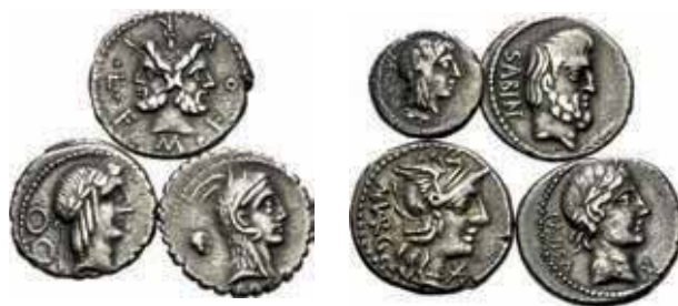
392- Lot de 7 deniers. Familles Calpurnia, Furia, Roscia, Porcia, Tituria, Vargunteia, Vibia. Dans l'ensemble, Très Beau. Lot de 7 monnaies. 200/400