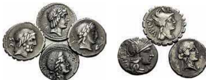
394- Lot de 7 deniers. Familles Antonia, Calpurnia, Crepusia, Egnatia, Lucretia, Pobjicia, Titia. Dans l'ensemble, Très Beau. Lot de 7 monnaies. 200/400